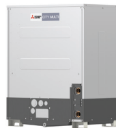
PQHY-P200YLM-A1 PQHY-P250YLM-A1 PQHY-P300YLM-A1