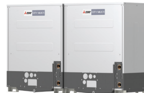
PQHY-P400YSLM-A1 PQHY-P450YSLM-A1 PQHY-P500YSLM-A1 PQHY-P550YSLM-A1 PQHY-P600YSLM-A1