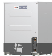
PQRY-P200YLM-A1 PQRY-P250YLM-A1 PQRY-P300YLM-A1