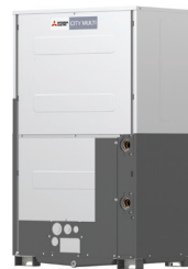
PQRY-P350YLM-A1 PQRY-P400YLM-A1 PQRY-P450YLM-A1 PQRY-P500YLM-A1 PQRY-P550YLM-A1 PQRY-P600YLM-A1