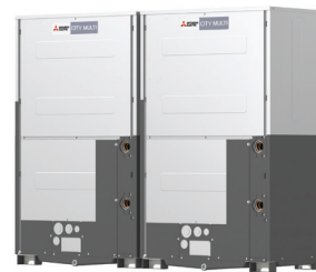
PQRY-P700YSLM-A1 PQRY-P750YSLM-A1 PQRY-P800YSLM-A1 PQRY-P850YSLM-A1 PQRY-P900YSLM-A1