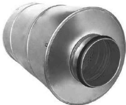
Шумоглушитель трубчатый круглый ГТК L = 980 мм