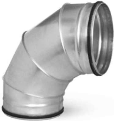
Размеры и технические характеристики